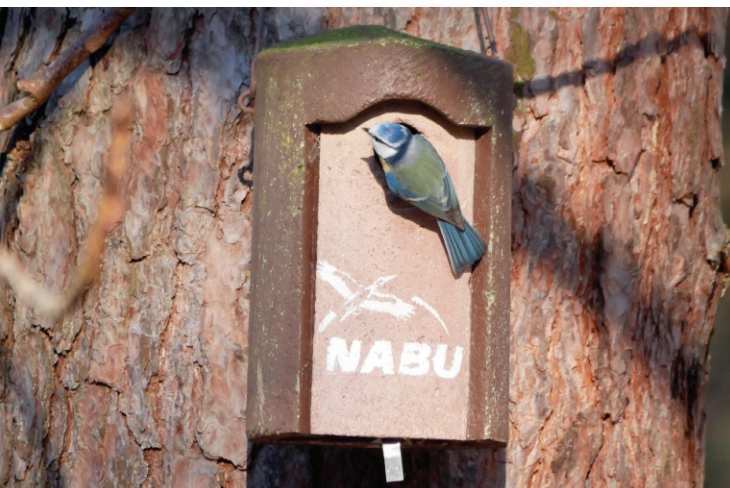
Nistkastenreinigung mit den Pfadfindern: Ist die Wohnung schon sauber?