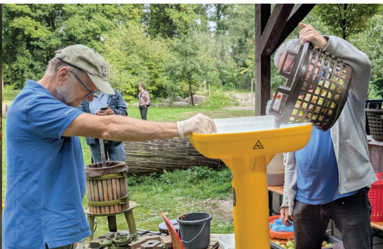
Kelterfest an der Waldschule: Äpfel in Hülle und Fülle geben leckeren Apfelmost.