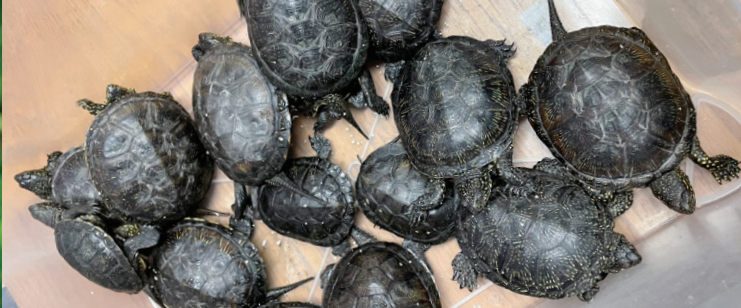
Heimische Sumpfschildkröten vor der Auswilderung

Auch seltene Pflanzen findet man bei uns.