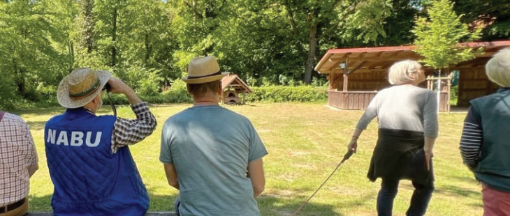
Beobachtungen bei der Stunde der Gartenvögel.