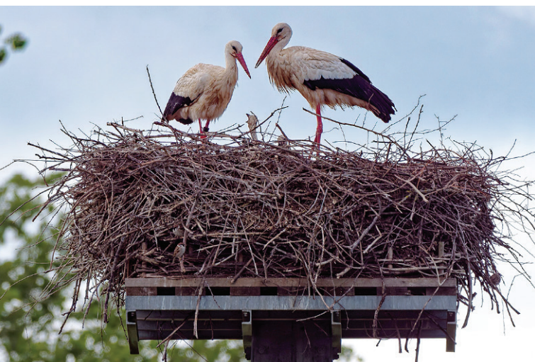
Störche an der Naturschutzscheune

Nachdem die Graureiher, Kormorane und Weißstörche von den Waschbären am Reinheimer Teich vertrieben wurden, haben sich mehr als 10 Störchen-Brutpaare entlang dem Landwehrgraben zwischen Scheelhecke und Reinheimer Teich angesiedelt. Auch in den Hergershäuser Wiesen gab es letztes Jahr 13 erfolgreiche Bruten.