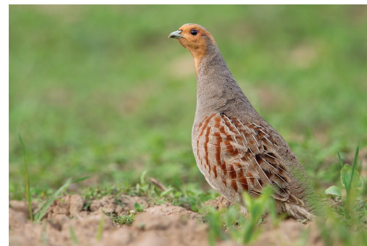
Rebhuhn: Der Vogel des Jahres 2026

Die zur Familie der Hühnervögel zählenden Tiere sind perfekt getarnt für ein Leben am Boden, wo sie scharrend und pickend nach überwiegend vegetarischer Nahrung suchen oder Sand- und Staubbäder nehmen. Die Weibchen legen bis zu 20 Eier in gut versteckte Bodennester. Nach dem Schlüpfen kümmern sich beide Eltern um die Küken, die nach fünf Wochen selbstständig sind. Gerade in dieser Zeit benötigen die Jungtiere proteinreiche Nahrung wie Insekten, Spinnen und andere Kleintiere, damit sie schnell wachsen können. Die Familie bleibt als „Kette“ bis zum Winter zusammen. Seit 1980 ist der Bestand in Deutschland um 87 Prozent zurückgegangen – eine alarmierende Entwicklung.