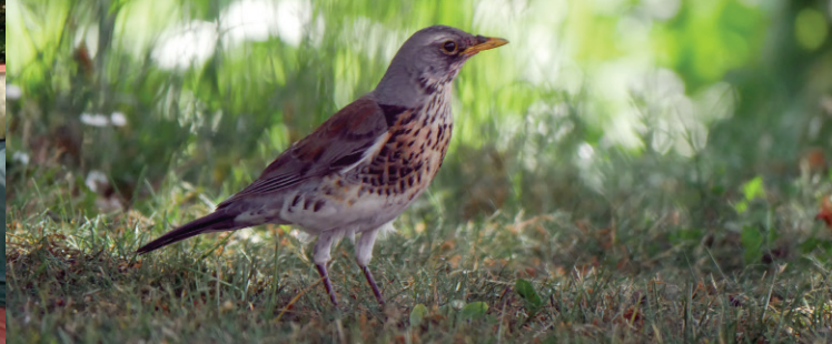
Wacholderdrossel in der „Grünen Mitte“.